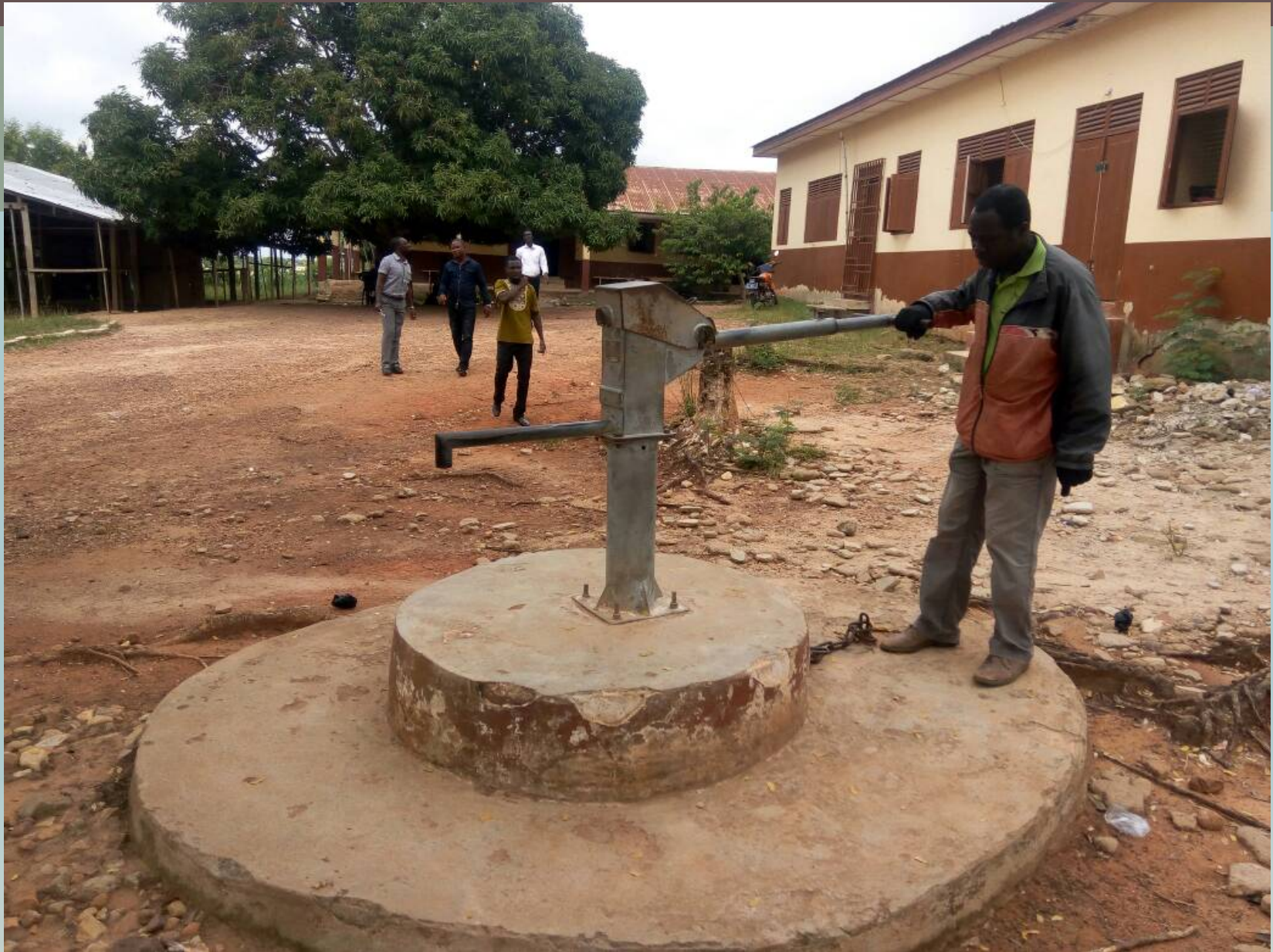
Einer der defekten Brunnen.